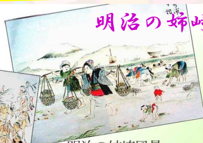
明治の姉崎風景 「故郷姉崎町年中行事」 明治43年 齊藤孝編纂より

講演の前にインターネット上の「姉崎郷土資料館」をぜひご覧ください！ 「姉崎郷土資料館」と検索すれば出てきます。今では地元民も知らないことが一杯記載されています。ぜひ検索下さい！