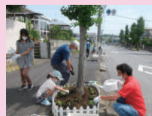
▼暑い中、多くの方に集まっていただき楽しく行われました

た後の余剰苗をノアールの店頭で通りがかった皆さんにお配りしました。無料と聞いてびっくりされる方や、街路樹花壇に植えるため皆で種から育てた苗であることを聞いて大切に育てますという方も多くいらっしゃいました。花壇とともに各家庭でもお花がいっぱいとなるといいですね。(大竹)