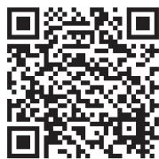
▲ユーザー登録方法HP

市原市では、いちほら推し活制度(通称「イチ押し」)が始まりました。青葉台も「イチ押し」を活用して、これからの街づくりを展開していきます。