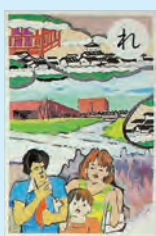
【れ】歴博で 暮らしの歴史 見て学び