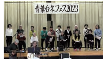
④野菊の会：コーラス