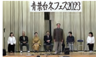
⑦錦鏡場詩吟倶楽部：詩吟