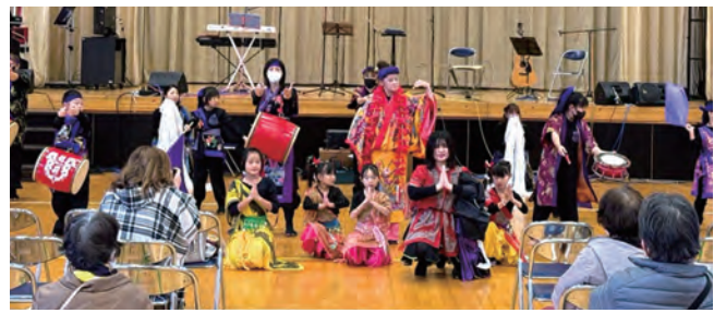
②沖縄民謡・ベリーダンスと演奏(ゆいまーる龍覇、こころ舞踊団、OTTO)