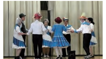
⑧青葉睦会スクエアダンス部：スクエアダンス