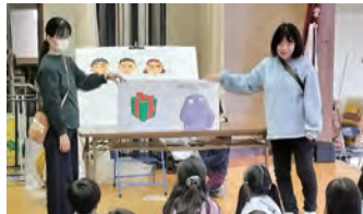
⑤あおば台文庫：読み聞かせ