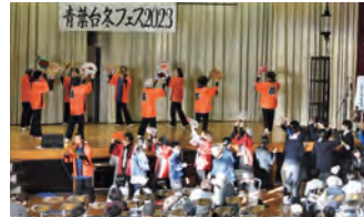
⑪青葉台緑会舞踊部：盆踊り