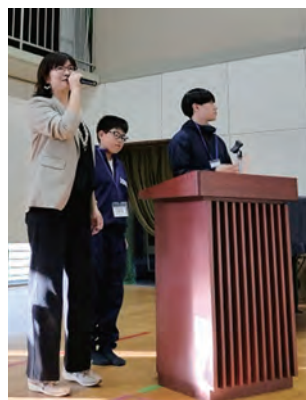
▲姉崎高校、姉崎東中の生徒も大活躍