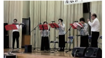
②姉崎ハーモニカクラブ演奏