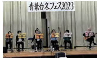
③ハーモニカドリーム演奏