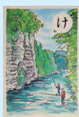
【け】溪谷の 流れ清らか 養老川