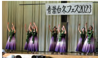
⑩ホンマ・バイスタイル・フラタジオ・オホノアロハ：ハワイアン演奏&踊り