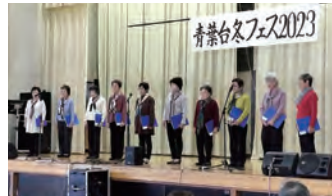
⑥ブルーエコー：コーラス